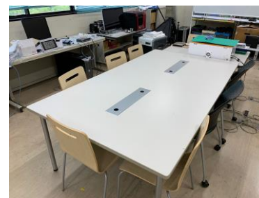
対象の共有機(左404, 右402)